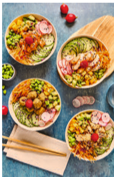
Pokawa se fournit en saumon chez Kvaroy Arctic, un poisson sans OGM ni antibiotiques.

Proposer des repas sains en réduisant son empreinte carbone, voilà l'objectif de Pokawa en matière de RSE. Depuis 2022, l'enseigne publie un rapport faisant l'état des lieux sur son impact environnemental. Avec comme objectif de servir des produits frais, traçables et de saison, les ingrédients choisis par Pokawa respectent de nombreux labels : les produits issus de la mer sont certifiés 100 % ASC et 100 % MSC (saumon, thon, crevettes). Le riz, quant à lui, est certifié 100 % IGP Camargue, et les produits HappyVore sont labellisés B Corp. Pour limiter les émissions de CO 2 , Pokawa a revu son système de livraison afin d'acheminer tous les produits en même temps, dans un seul camion. Appelé One Stop Delivery, ce système permet de diminuer le nombre de camions de livraison. La réduction des déchets est également une priorité. Ainsi l'enseigne utilise des emballages écoresponsables et a noué